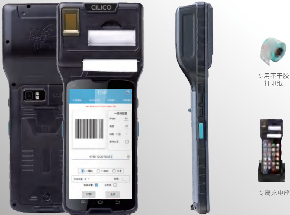
专用不干胶 打印纸